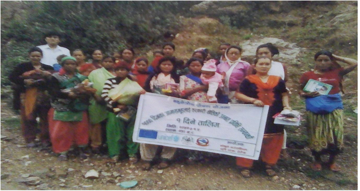
बहुक्षेत्रीय पोषण योजना अन्तर्गत १००० दिनका आमा समूहलाई तरकारी खेतीको उन्नत प्रविधि सम्बन्धि १ दिने तालिम