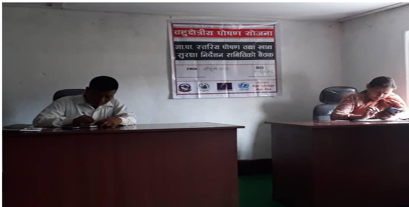
बहुक्षेत्रीय पोषण योजनाको गा. पा. स्तरीय पोषण तथा खाद्य सुरक्षा निर्देशन समितिको बैठक