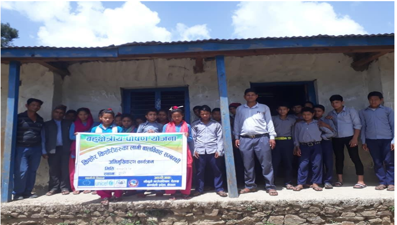
बहुक्षेत्रीय पोषण योजना अन्तर्गत वडा नं ३ दवारी र वडा नं ८ चौराठामा किशोर किशोरीहरूका लागि बालविवाह सम्बन्धि अभिमुखीकरण कार्यक्रम