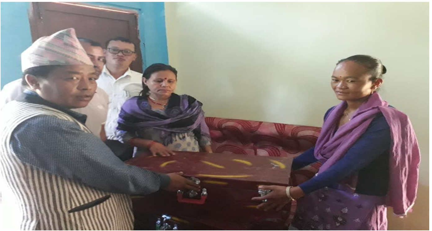
बहुक्षेत्रीय पोषण योजना अन्तर्गत बाल बिकास केन्द्रहरुलाई ECD (खेल सामाग्री) वितरण